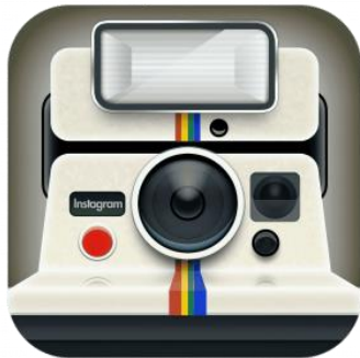
Gambar 2.2 : Tranformasi Logo Instagram

Jadi berdasarkan beberapa pendapat para ahli diatas, maka dapat peneliti simpulkan bahwa Instagram adalah aplikasi berbagi foto dan video yang memungkinkan pengguna mengambil foto, mengambil video, menerapkan filter digital, dan membagikannya ke berbagai layanan jejaring sosial, termasuk milik sendiri dalam bentuk feed dan story. Secara teknis, Instagram beroperasi sebagai jaringan sosial berbasis konten visual yang dapat digunakan untuk interaksi secara langsung melalui komentar, suka, serta pesan langsung.