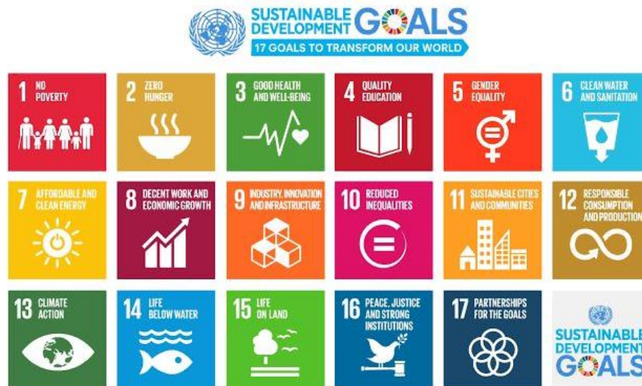
Gambar 2. 1 Pengungkapan 17 Tujuan Sustainable Development Goals (SDGs)