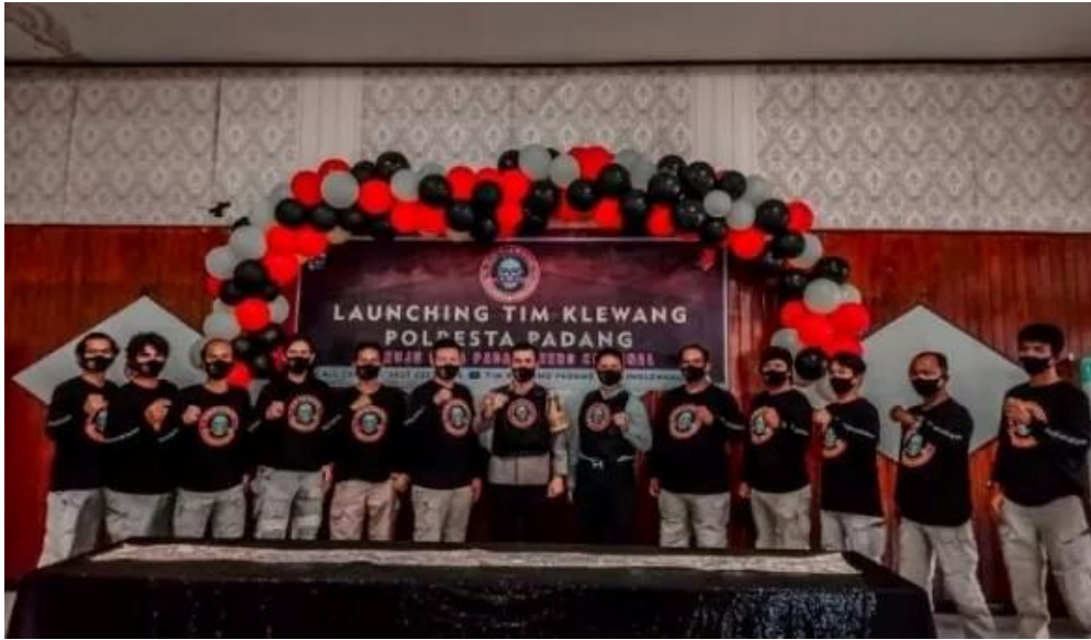
Gambar 2.3 Tim Klewang Polresta Padang