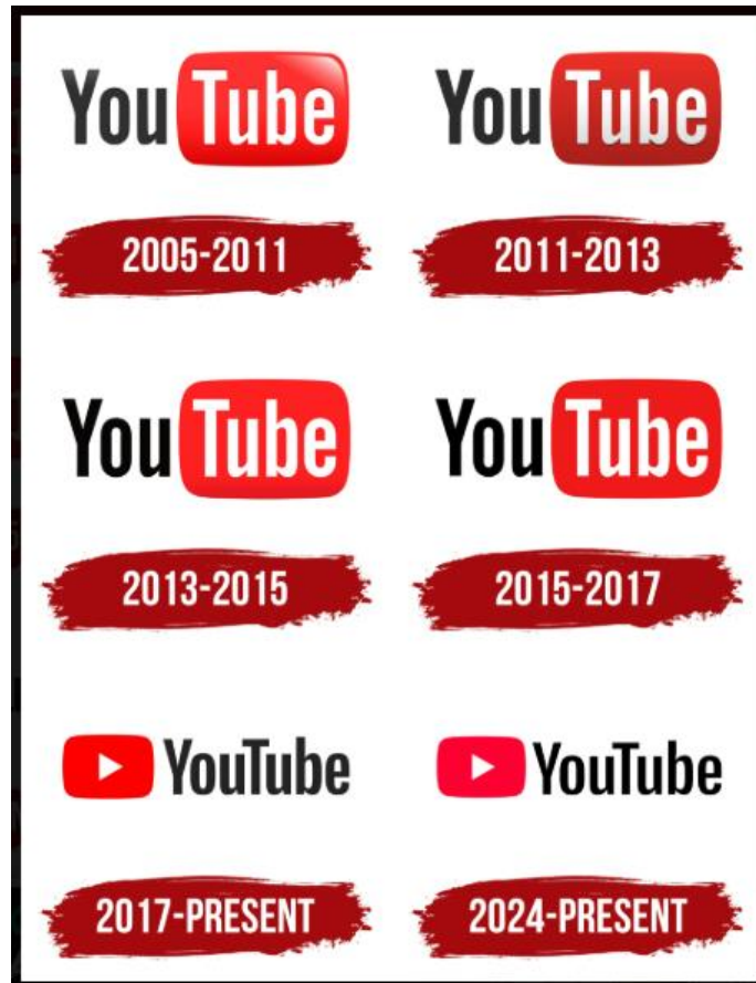
Gambar 2.1 Transformasi Logo YouTube